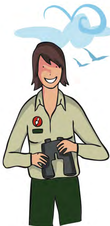
Figure 3 : La participation de bénévoles au côté des agents pour la surveillance permet à la fois de diminuer le nombre de départs de feux et d'améliorer l'efficacité de la sensibilisation.

Leurs activités et actions doivent être intégrées et coordonnées avec le reste des ressources engagées dans la prévention contre l'incendie afin d'optimiser les ressources.