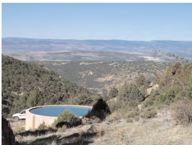
Photo 1 : Le réseau d’approvisionnement en eau est l’un des éléments centraux du dispositif de prévention des incendies dans la Région de Valence.

- Nous devrions fournir l’accès aux renseignements aux acteurs potentiels. Promouvoir la simplicité, la brièveté et l’accessibilité.