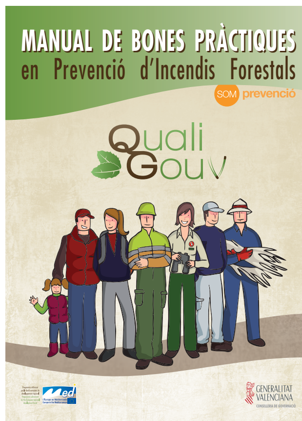
Figure 2 : Couverture du guide de bonnes pratiques pour la prévention des incendies dans les espaces protégés de la Région de Valence. Un document à la fois très complet, clair, accessible et attrayant sur le plan visuel.

Les manuels doivent être simples, directs, attrayants et adaptés au public ciblé.