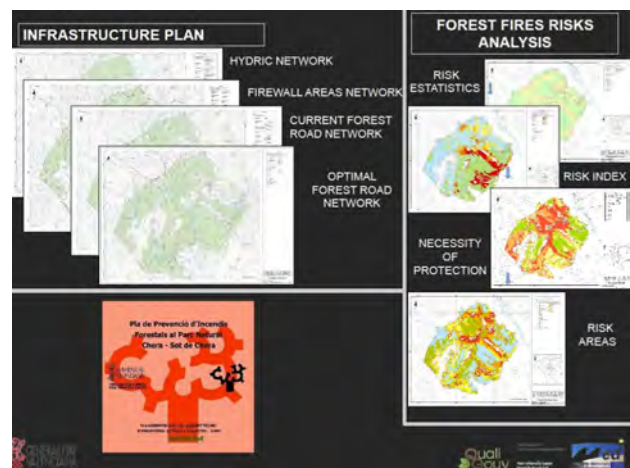
Figure 1 : Présentation du Plan de prévention des incendies du Parc de Puebla San Miguel à l’attention du grand public.

En raison des progrès limités dans le processus d’élaboration de ces plans, le gouvernement de la Région de Valence a mis en œuvre des mesures encourageantes telles que l’octroi de subventions économiques pour l’élaboration de plans de prévention, et le développement d’un guide méthodologique pour son élaboration en guise de soutien aux entités locales. Les deux actions peuvent être considérées comme des moyens d’améliorer la gouvernance verticale avec l’aide du projet QUALIGOUV.